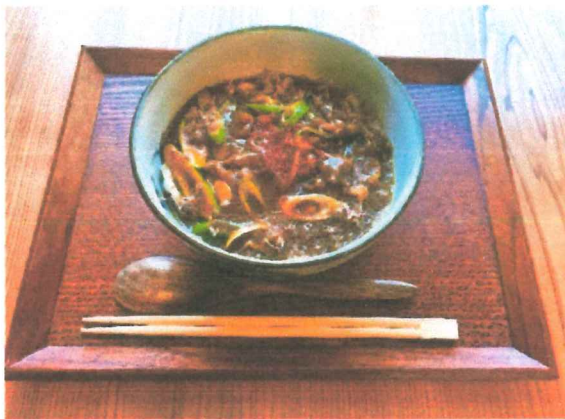
和風カレーうどん 750円